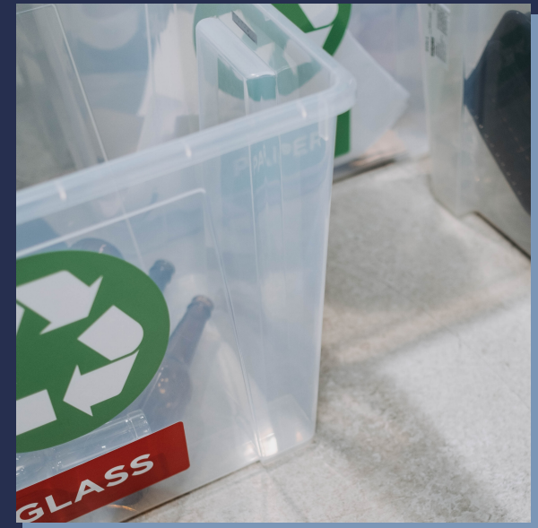
Раздельный сбор мусора